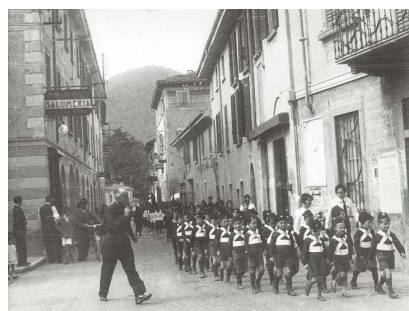
Sfilata di Balilla lungo via Vittorio Emanuele II, ora via Mazzini.

Terminata la prima guerra mondiale e visti sfilare nei propri uffici i reduci dal fronte che, finalmente congedati, si avviavano a riprendere una vita normale, con l'avvento del fascismo palazzo Tentorio aumentò ancor più, agli occhi della popolazione, il suo valore simbolico.