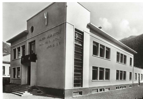
La nuova sede delle scuole elementari inaugurata nel 1933

A palazzo Tentorio rimase quindi la sola funzione di palazzo del Comune; oltre che di sede della normale attività amministrativa, occorre ricordare, di quegli anni, il ruolo di "propagatore" dei messaggi del duce. In occasione infatti dei discorsi più importanti, la popolazione era "caldamente" invitata a recarsi davanti al palazzo dal quale, attraverso gli altoparlanti, veniva diffusa la voce di Mussolini. Le scuole erano presenti al completo, le osterie dovevano obbligatoriamente chiudere i battenti per tutto il tempo necessario, i responsabili della sezione locale del partito controllavano i presenti ma soprattutto annotavano gli assenti.